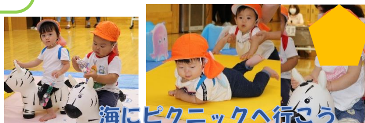
海にピクニックへ行こう